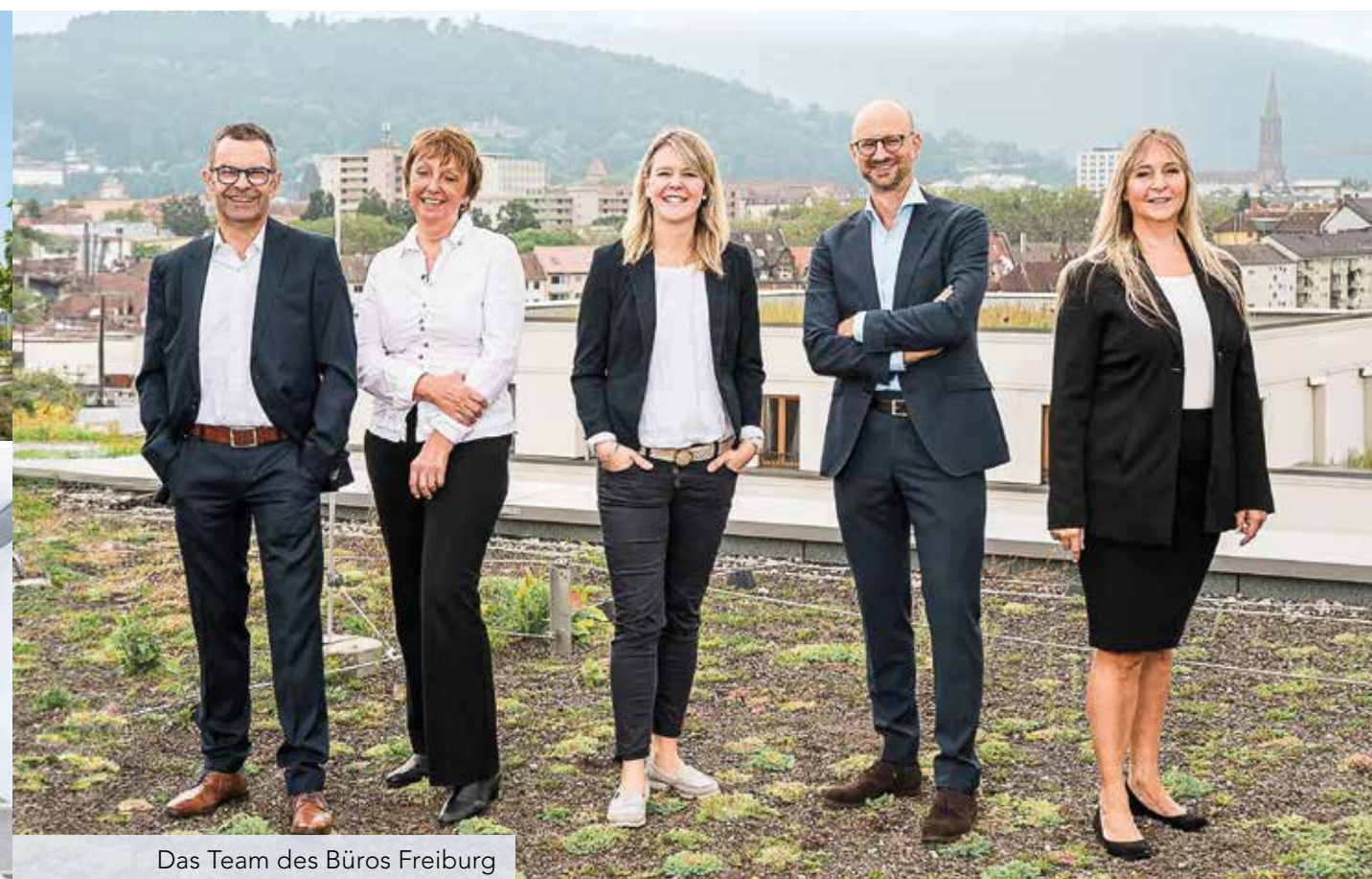
Das Team des Büros Freiburg