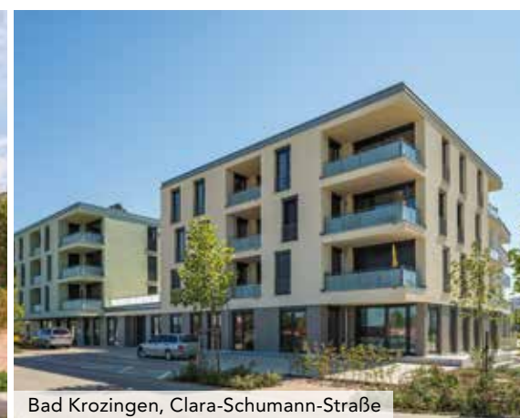
Bad Krozingen, Clara-Schumann-Straße