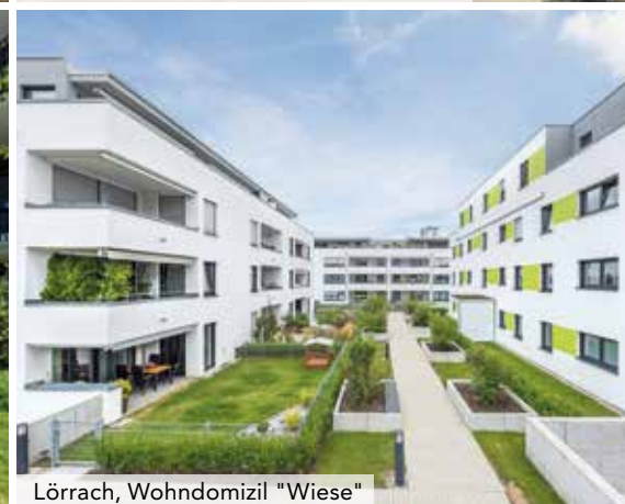
Lörrach, Wohndomizil "Wiese"